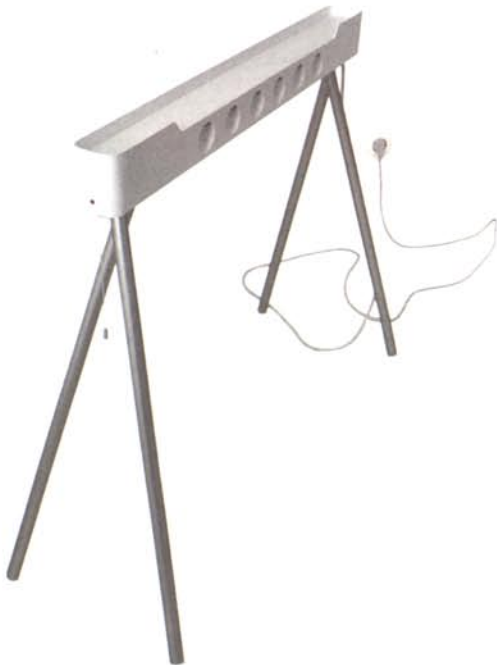
Der „Ebock“ von Frey + Boge räumt auf: Unter der Tischplatte bietet er sechs Anschlussmöglichkeiten für elektronische Geräte.