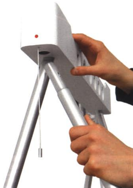
Einfach und clever: Die Beine sind durch ein Federprinzip fixiert. Für den Transport werden sie abgenommen und in der Ablage oberhalb der Steckdosenleiste (s. Abb. oben links) verstaut.